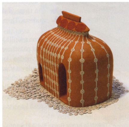
Yritykset, 2013, suomalainen punasavi.

Muita selviytymiskeinoja minulla ovat ystävien – niin lapsellisten kuin lapsettomien – tuki ja tärkeimpänä puolisoni tuki. Meitä lapsettomuuden yhteinen kokeminen on lähentänyt. Tapaan mielelläni ystäväni lapsia. Minulla on kaksi kummilasta, ja rakastan veljeni lapsia.